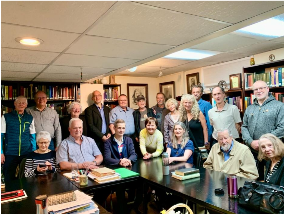
Les membres de la branche indépendante d'Edmonton