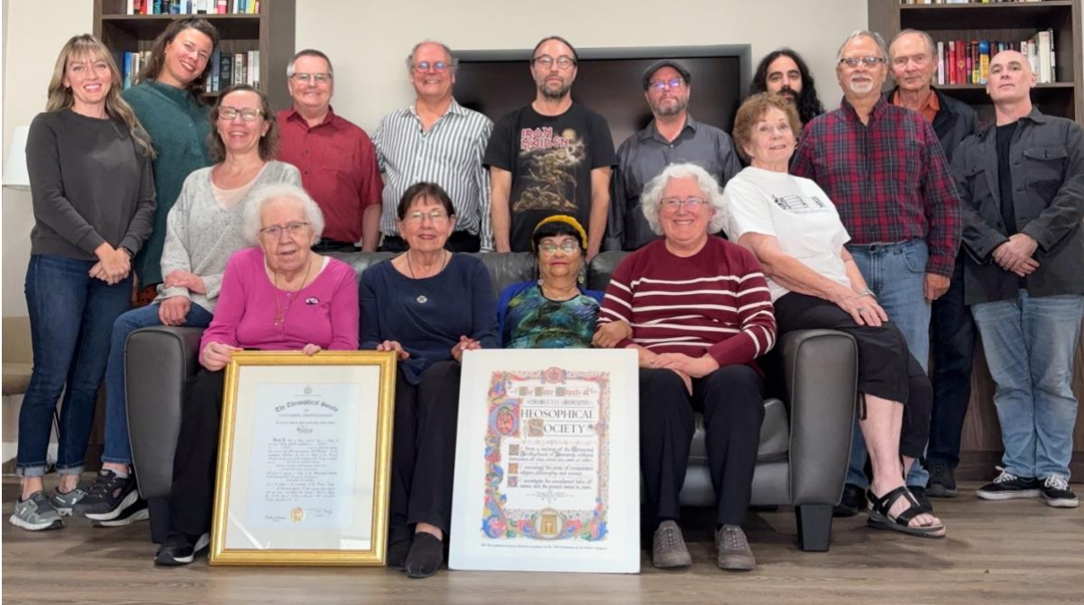
Membres de la branche de Calgary