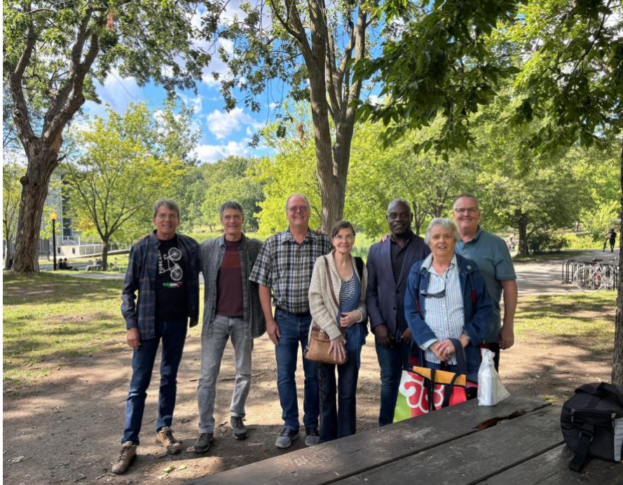
Rencontre amicale de la Branche Satya tenue au Parc La Fontaine, Montréal, le 31 août 2025.